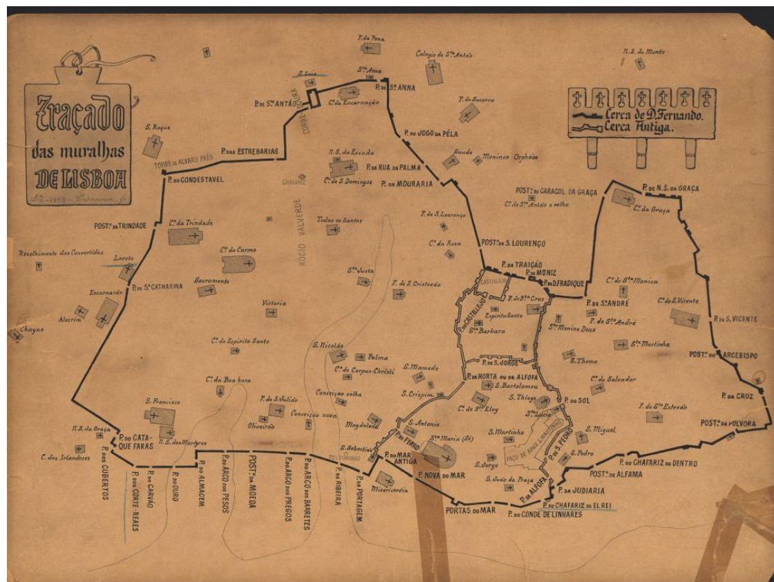
» Traçado das muralhas de Lisboa. Enrique Casanova, 1892. Biblioteca Nacional.

No século XIV a extensão da cidade de Lisboa vai além da muralha moura. Este é o resultado de uma cidade em crescimento que revela uma atividade comercial intensa e que atrai, entre outros, a presença de muitos mercadores. O prestígio da cidade e as circunstâncias políticas do país despertam a cobiça estrangeira que se intensifica por parte dos vizinhos de Castela. Em 1373, D. Fernando I, cognominado O Formoso ou O Belo , consciente desta situação manda construir uma cerca nova e maior, conhecida atualmente por muralha fernandina.