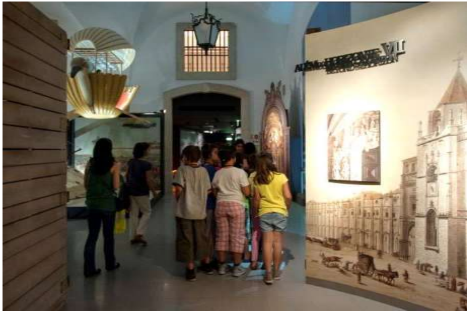
Núcleo VII – Além do Horizonte.

O Lisboa Story Centre é um espaço dedicado à cidade de Lisboa que combina conhecimento e tecnologia. Ao longo de 60 minutos propõe-se uma viagem no tempo, percorrendo 20 séculos de história da capital, desde a sua fundação até aos dias de hoje.